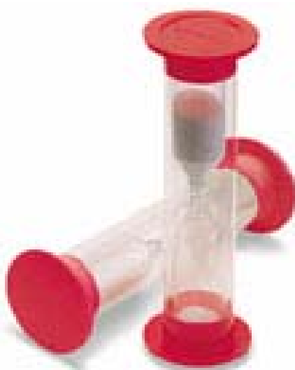
Referência 2209.13.0304 DESIGNAÇÃO AMPULHETA C/2 (1 e 2 MINUTOS)