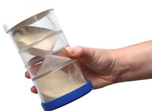
Referência 2209.13.0940 DESIGNAÇÃO AMPULHETA (3 EM 1)