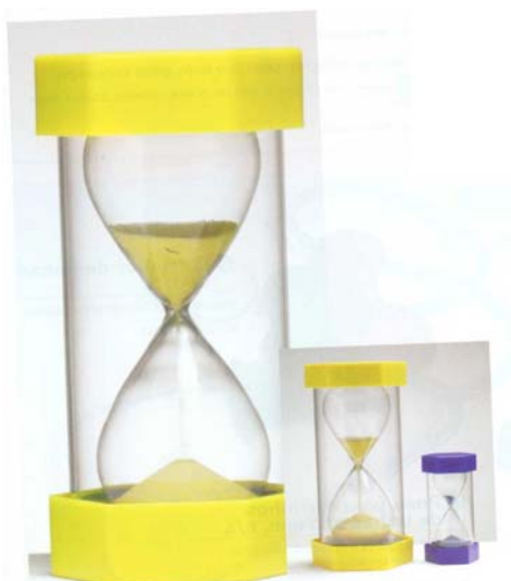
Referência 2209.13.0602 DESIGNAÇÃO AMPULHETA 3 MINUTOS